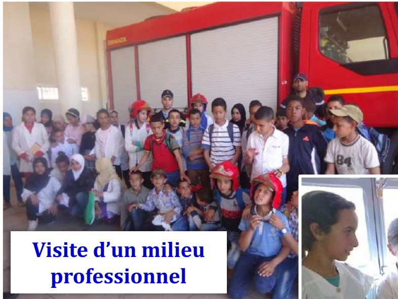
Visite d'un milieu professionnel