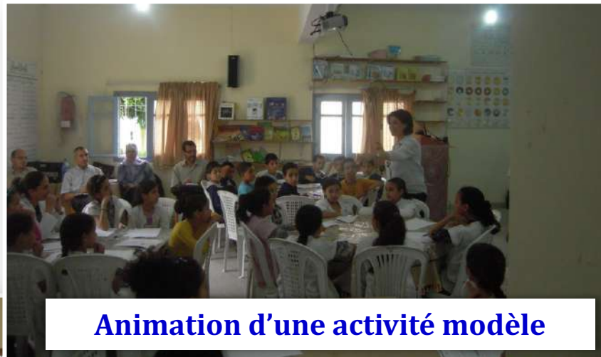
Animation d'une activité modèle