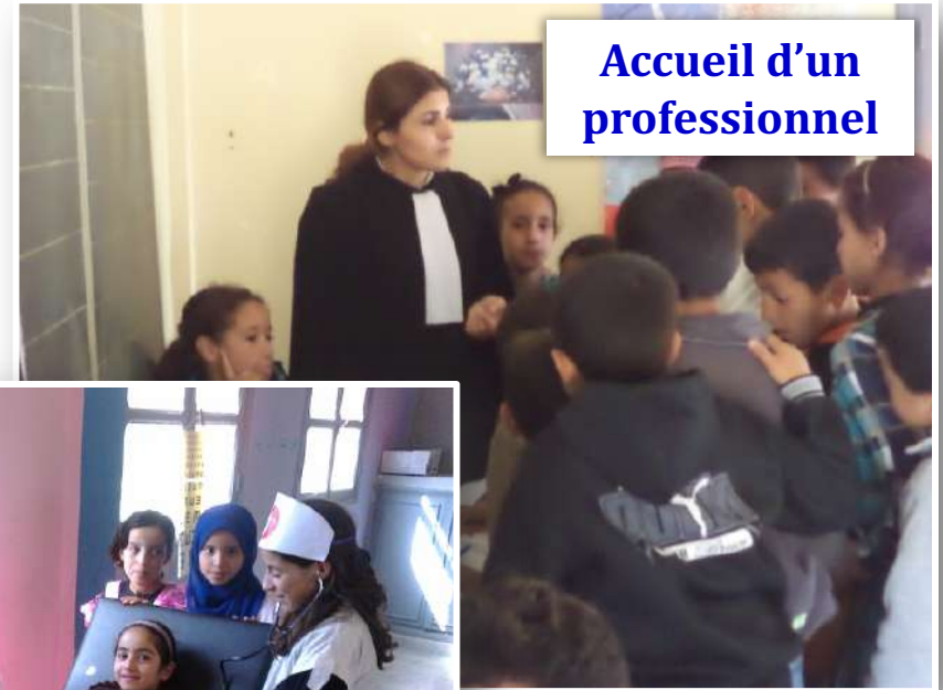
Accueil d'un professionnel