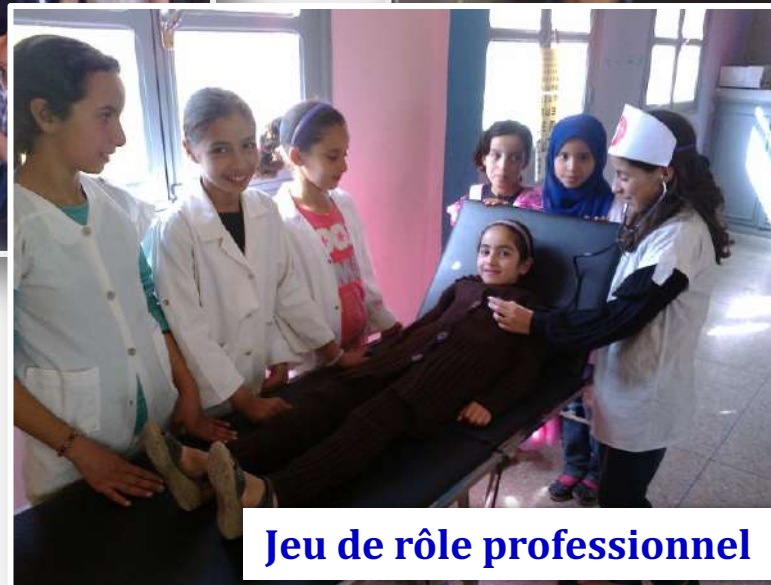
Jeu de rôle professionnel